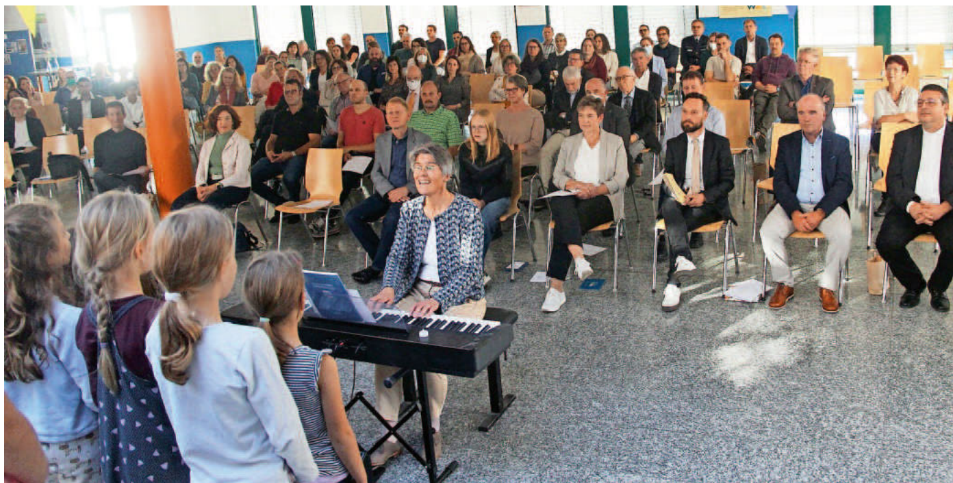
Zahlreiche Vertreter aus Schule, Politik, Verwaltung, Kirchen und Firmen nahmen an der Feierstunde in der Aula der Wilhelm-August-Lay-Schule teil.