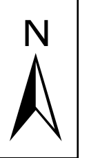
Abbildung: UTM 32N Projektion: Transverse Mercator Datum: ETRS 89 Höhendaten basierend auf Befliegungen ab 2016 Geobasisdaten © Landesamt für Geoinformation und Landentwicklung Baden-Württemberg, www.lgl-bw.de, Az.: 2851.9-1/19